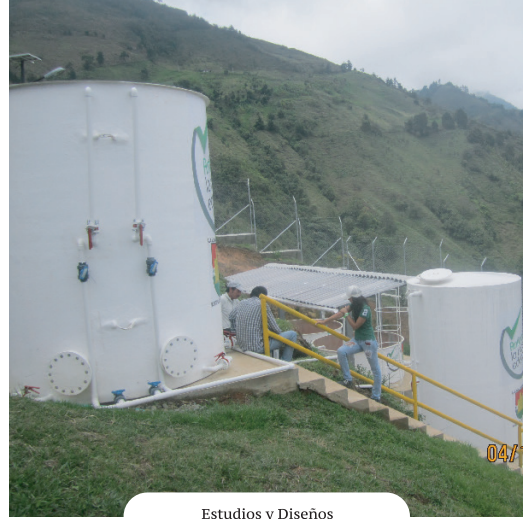
Estudios y Diseños

Interventoría obras de acueducto y alcantarillado zonas rurales y urbanas